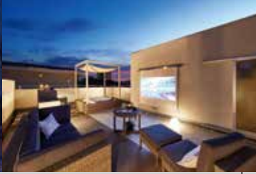
洗練された外観デザイン