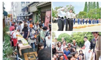
▲ 2017年4月29日 どっぶり昭和町に協賛

地元とともに歩いていくために、私たちが活発な事業を続けていくために、地域の活性化に貢献することはとても重要なミッションとなります。少しでも多くの繋がりを持ち、私たちにできることをしていくことで、私たち自身の地元への愛着が増し、これからの事業の活力になっていきます。