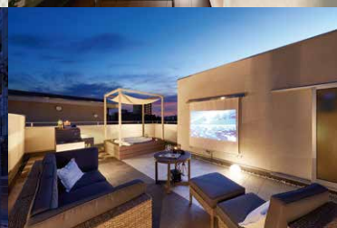
洗練された外観デザイン